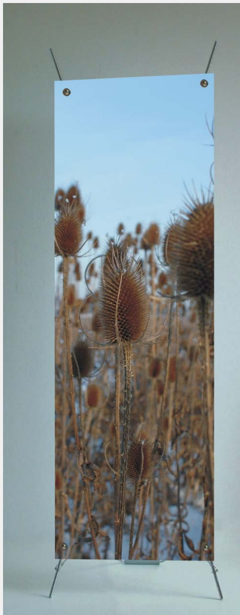
Widok z przodu.