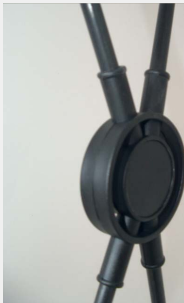
Środkowy element mocujący.