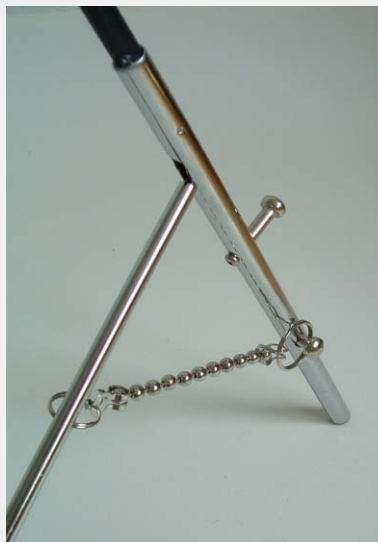
Mocowanie podpory tylnej.