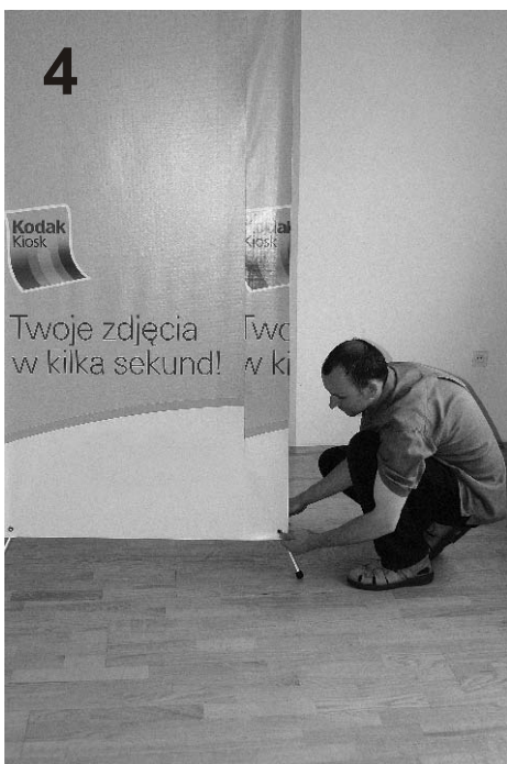
4 Po założeniu banera na górne uchwyty, naciągamy go w dół i zakładamy na dolne uchwyty.