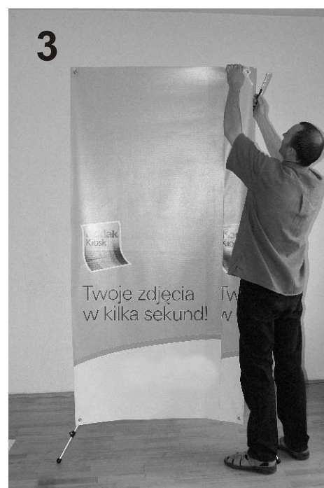
3 Baner zaczynamy zakładać od góry.