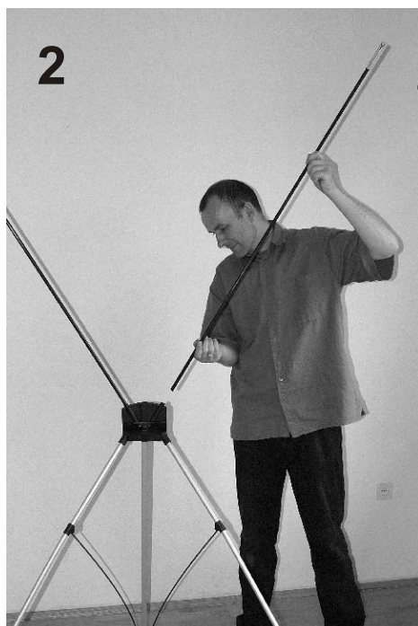
2 Włożyć ramiona górne.