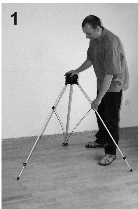
1 Rozstawić dolną część stojaka.