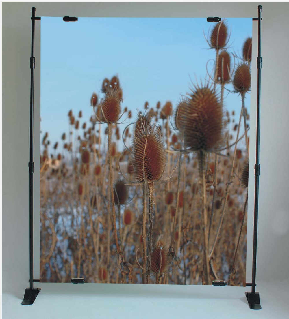
Stojak MMG widok z przodu