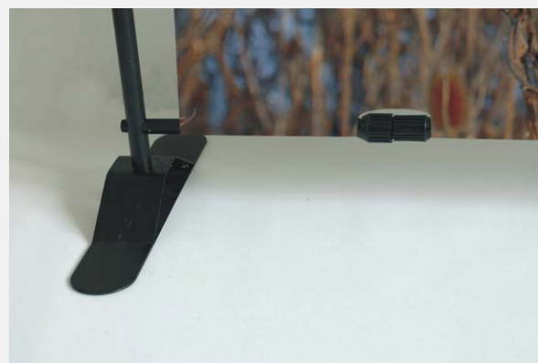
Dolna część stojaka ze stopą.