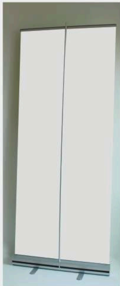
Stojak MMRbs widok z tyłu.