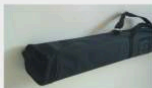
Torba z materiału chroni stojak podczas transportu.

W modelach o szerokości 85 i 100 cm stojaki posiadają dwie nogi i jeden maszt.