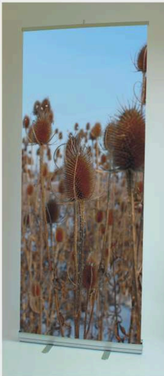
Stojak MMRbs widok z przodu.