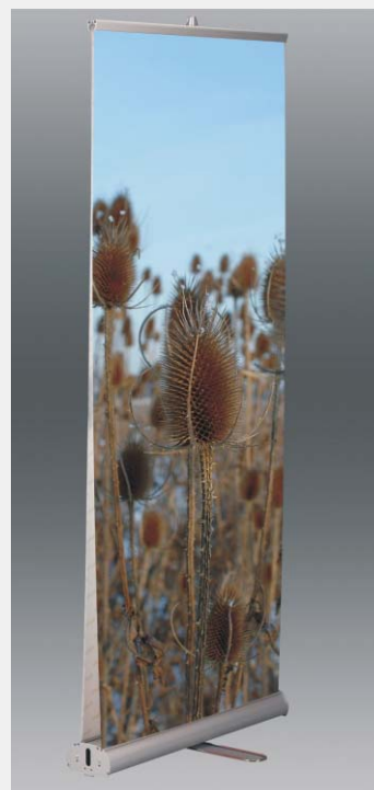
Stojak dostępny jest również w wersji dwustronnej - MMRs2

Model 120 cm posiada dwie nogi i dwa maszty.