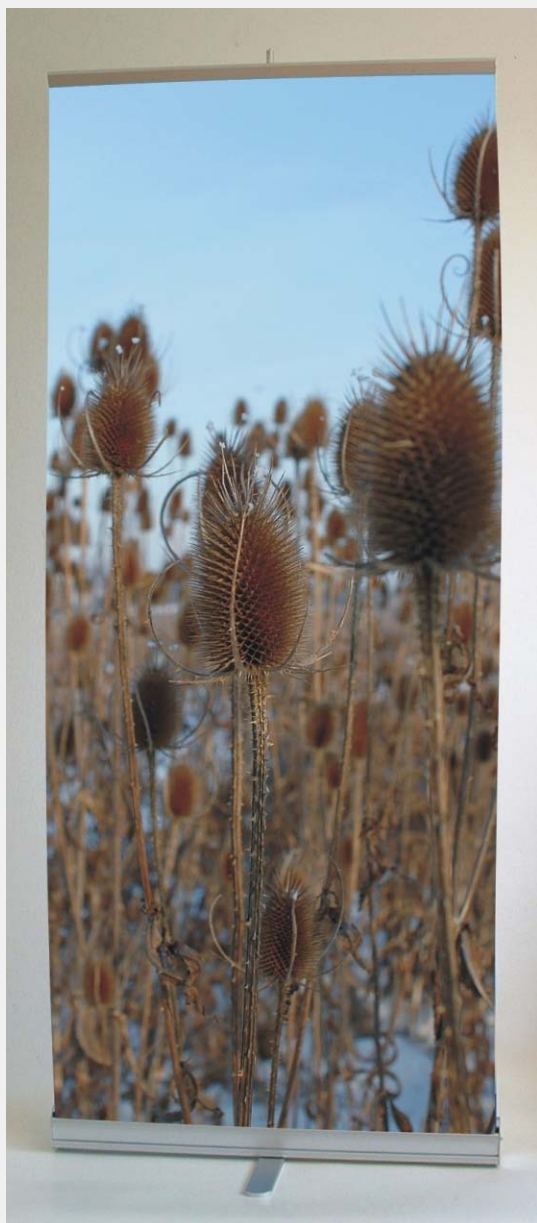
Stojak MMRs widok z przodu.