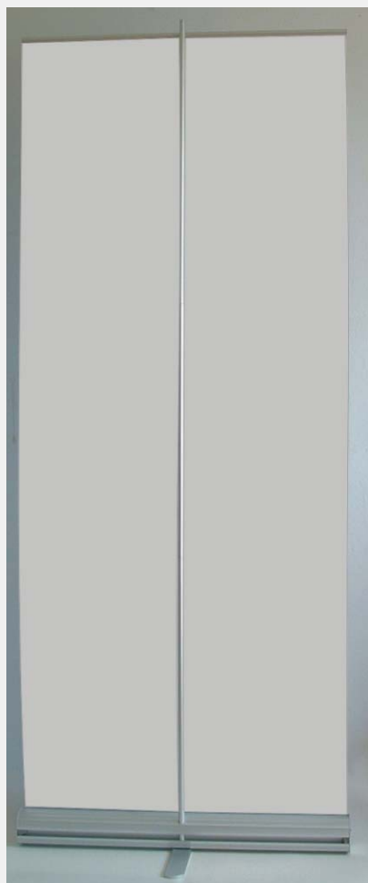
Stojak MMRs widok z tyłu.