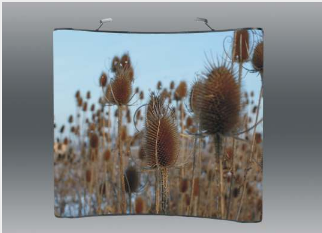
cianka MMW LUX widok z przodu.